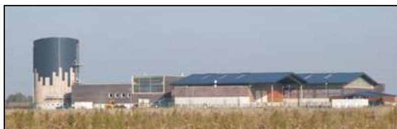
Vue d'ensemble de l'usine de méthanisation de Calais

Afin de sensibiliser nos élus, nous vous remercions de signer la pétition CONTRE l'installation de l'usine de méthanisation à Lamorlaye.