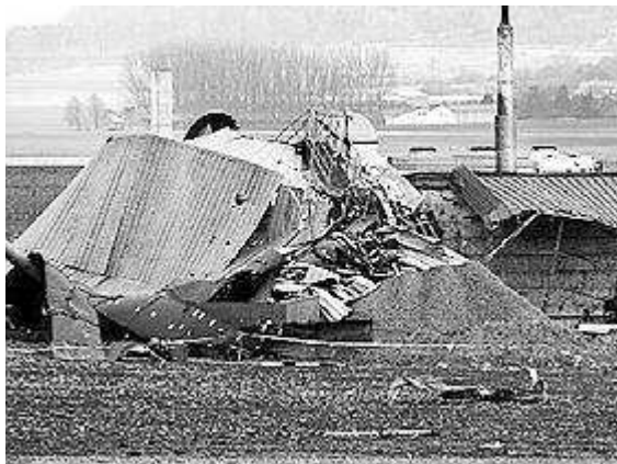
Usine de méthanisation de Riedlingen-Daugendorf a été totalement détruite par l'explosion. Décembre 2007

Le risque d' explosion étant connu, le bon sens et le principe de précaution amènent à l'abandon du projet.